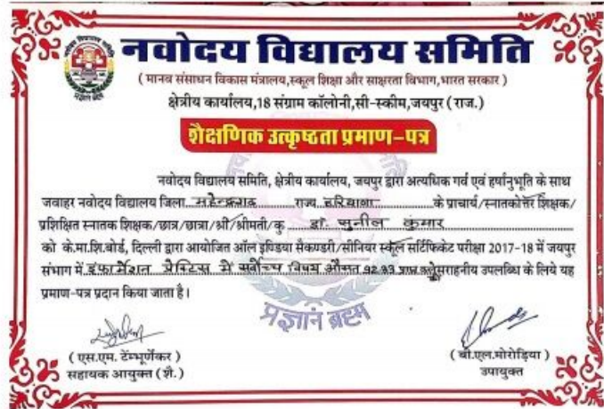
Appreciation Certificate by Deputy Commissioner NVS RO Jaipur